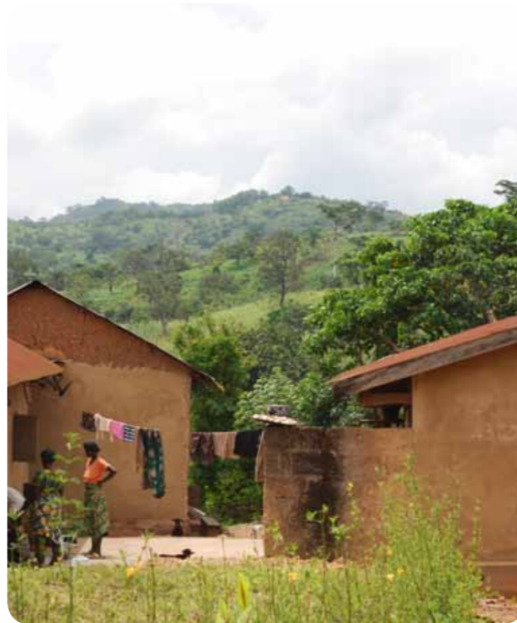
Foto från byn Tokpli, CRASE ligger inbäddad i grönskan på bergets topp i bakgrunden.