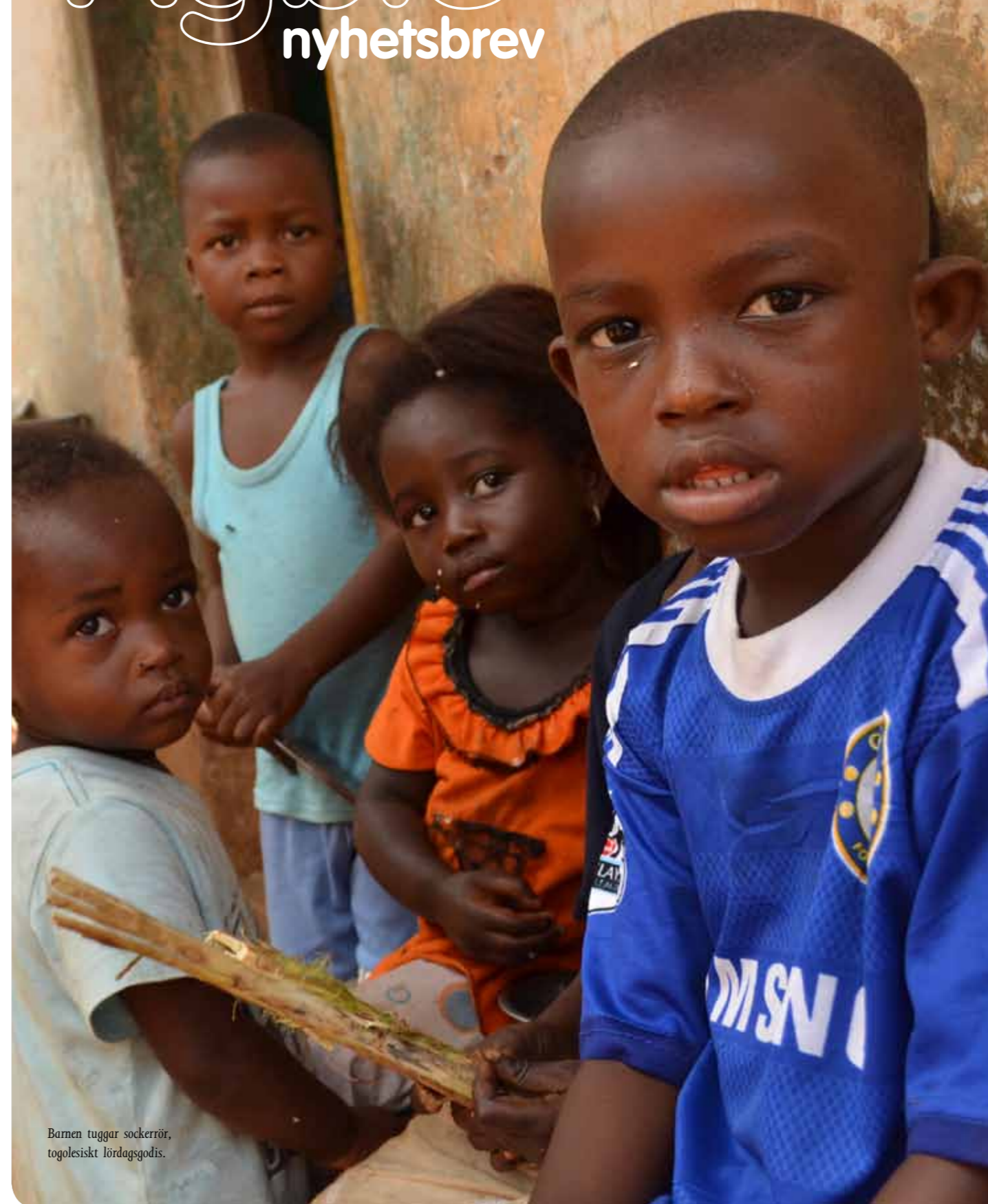
Barnen tuggar sockerrör, togolesiskt lördagsgodis.