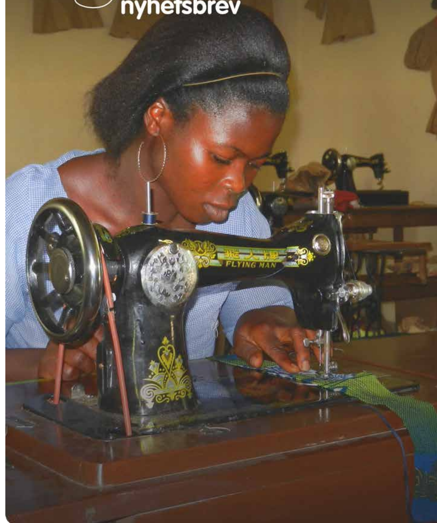
Koncentration på sylktionen.